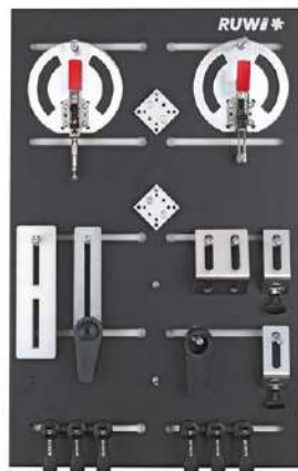
Gli articoli possono essere ordinati anche separatamente