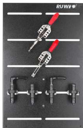
Gli articoli possono essere ordinati anche separatamente